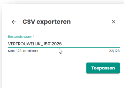
Figuur 3: Het menu voor het invoeren van de bestandsnaam en het voltooien van de export.